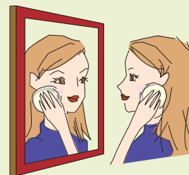
コンパクトパウダーミニ「ナチュラル」 (超微粒子パウダー)

超微粒子のプレストパウダーです。お顔につけた美容液や化粧水が完全に乾いてから、専用のパフで押さえるようにしてつけましょう。何度も重ねてつけても厚塗りにならず自然な仕上がりに。お肌が弱い方でも安心して使えます。