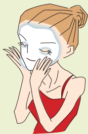
フレッシュアップSP (粘土洗顔)

大さじ1杯くらいを手の平に取り両手でよく伸ばし、触れた素顔にやさしくなでて伸ばしていきます。時間をおかずにすぐに洗い流しましょう。