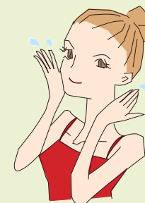
アクアローション (さっぱりタイプ) (化粧水)

洗顔の仕上げにシューっとひと吹きしてください。お肌をクールダウンさせて潤いを与えます。