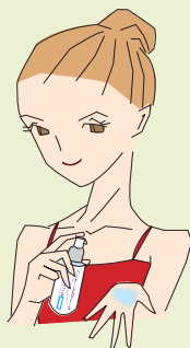
インターアクションSP (水溶性美容液)

手のひらに100円玉ほど取り、満遍なくお肌につけましょう。透明な保護膜を形成し、お肌を守ります。赤みやニキビには消炎効果も発揮します。